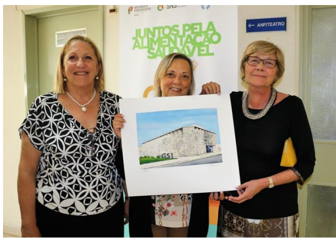
Melhor poster da 11.ª Reunião Anual PortFIR ||| 10 anos PortFIR e entrega do prémio.