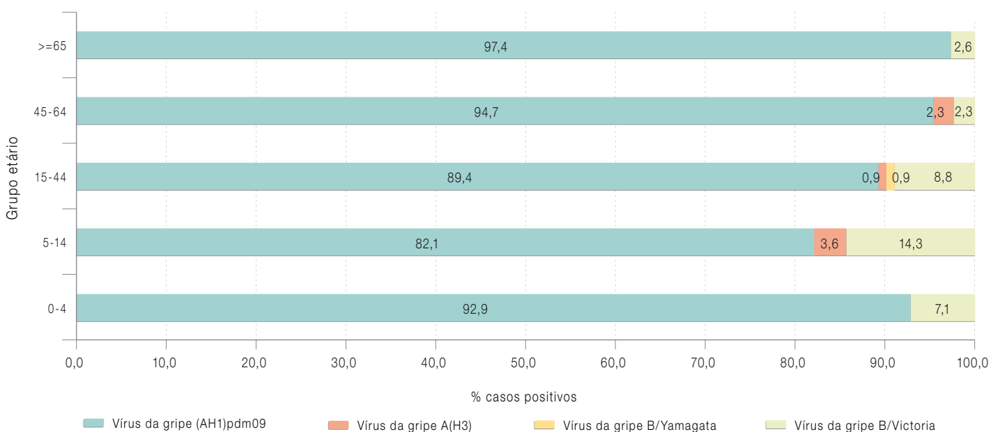
Gráfico 3: ⚓ Casos de gripe por grupo etário na época de 2015/2016.

Foram excluídos da análise 20 casos, por falta de informação sobre a idade.