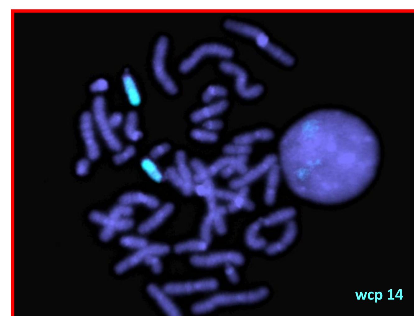
Figura 2 – FISH com sonda de pintura cromossómica total (wcp) específica do cromossoma 14.