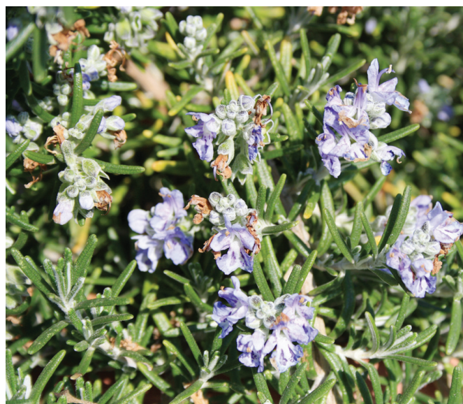
Alecrim ( Rosmarinus officinalis L.)

O Instituto Nacional de Saúde Doutor Ricardo Jorge (Instituto Ricardo Jorge) tem em curso um projeto de investigação que visa desenvolver uma embalagem biodegradável para aumentar a vida útil dos alimentos. Com o acrónimo de “Rose4Pack”, os investigadores têm pela frente um importante desafio na área da nova geração de embalagens alimentares.