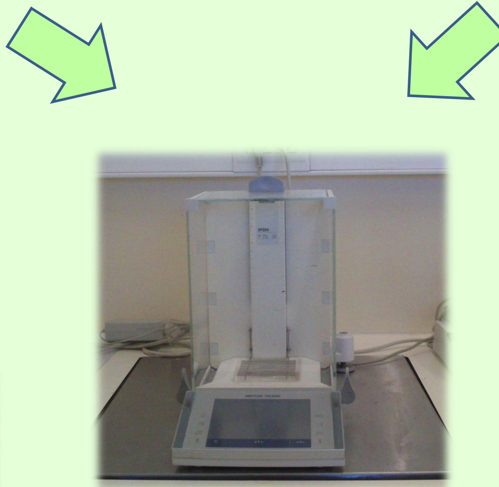
Figura 5- Balança para determinação por método gravimétrico