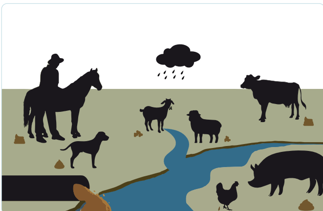
Figura 1: Representação esquemática de diferentes fontes possíveis de contaminação de águas fluviais.

Cada uma dessas fontes apresenta um risco diferente para a saúde humana, sendo a água dos esgotos a mais nociva (12,17,18), já que podem conter microrganismos patogénicos vários, de origem humana e animal (3,5,7-12,16,17). Assim, é importante destacar que a principal fonte de contaminação dos ambientes aquáticos naturais está associada às águas de esgotos domésticos e industriais não-tratadas ou que são sujeitas a tratamentos insuficientes/inadequados (figura 2) (3,7,10,15,16).