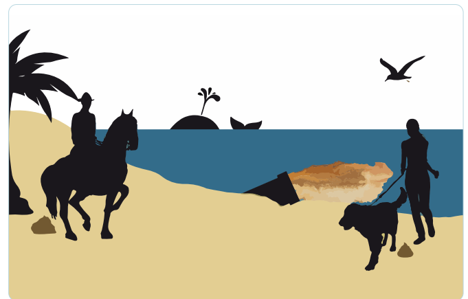
Figura 2: Representação esquemática de diferentes fontes possíveis de contaminação de águas balneares.

Cada uma dessas fontes apresenta um risco diferente para a saúde humana, sendo a água dos esgotos a mais nociva (12,17,18), já que podem conter microrganismos patogénicos vários, de origem humana e animal (3,5,7-12,16,17). Assim, é importante destacar que a principal fonte de contaminação dos ambientes aquáticos naturais está associada às águas de esgotos domésticos e industriais não-tratadas ou que são sujeitas a tratamentos insuficientes/inadequados (figura 2) (3,7,10,15,16).