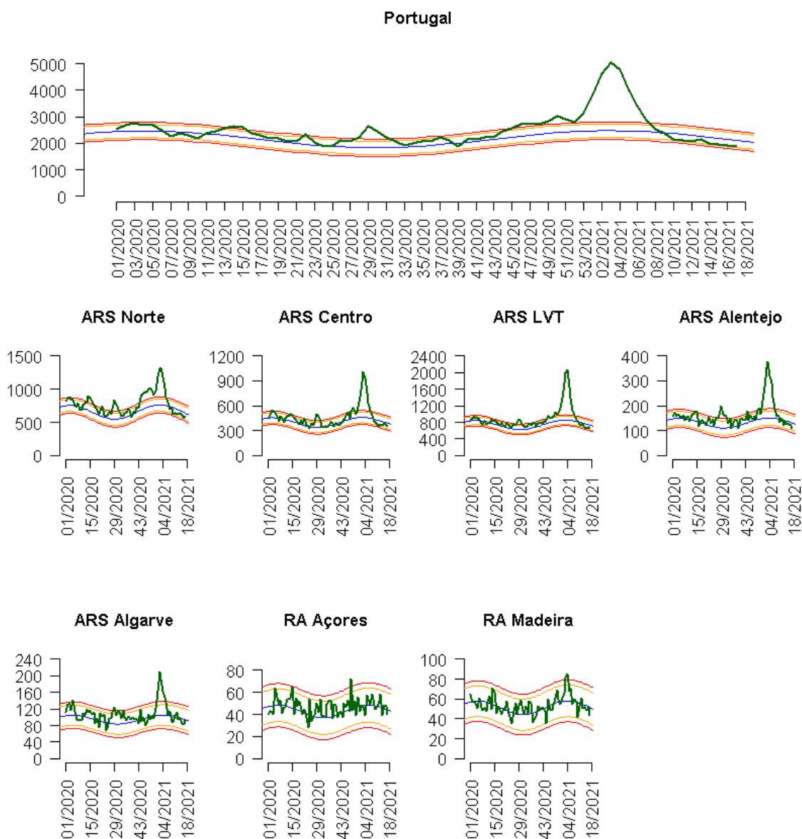
Figura 1: Evolução semanal do número de óbitos (representados a verde), em Portugal e nas áreas regionais de saúde (ARS) e regiões autónomas (RA). As linhas para referência correspondem ao número de óbitos esperados (ou linha de base, representada a azul), ao limite superior do intervalo de confiança a 95%, da linha de base (representado a laranja) e ao limite superior do intervalo de confiança a 99%, da linha de base (representado a vermelho). Fonte: sistema eVM (dados disponíveis a 2021-05-06).

da linha de base estimada para esta época do ano. Exceção feita para a região dos Açores, em que a mortalidade oscilou aleatoriamente em torno da linha de base (Quadro 1).