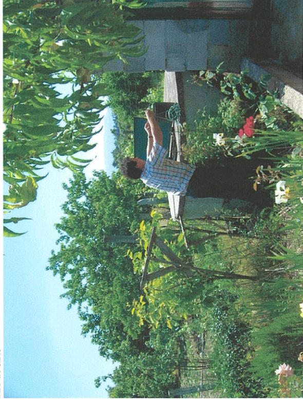
Canas de Senhorim