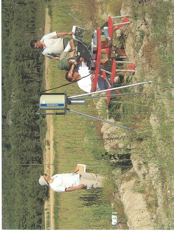
Rio de Mel