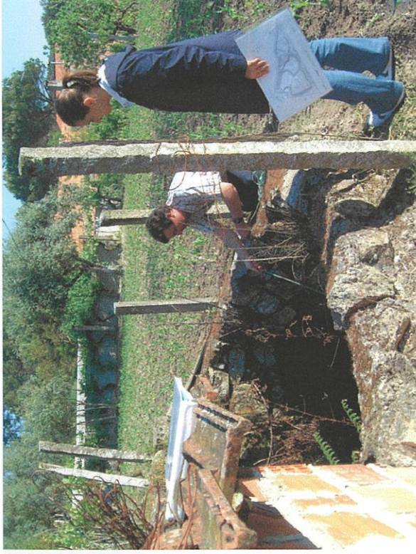
Canas de Senhorim