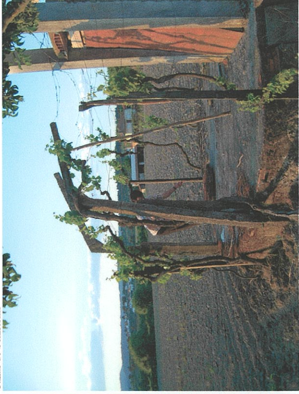
Calorico (S. Pedro)